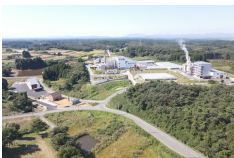
里山活性化の対象エリア